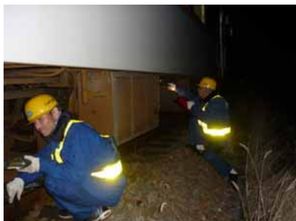
・車両の床下を点検する車両課社員