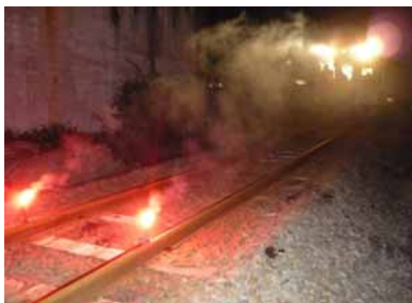
・列車衝突を防止するために信号炎管に点火