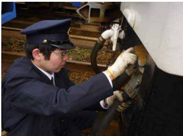
・新人運転士の現車訓練