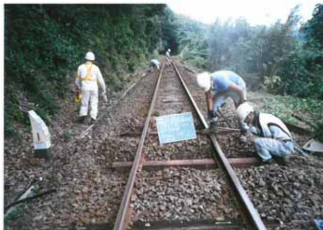
・有田～佐世保間の木マクラギ交換状況