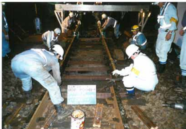
・真申駅、左石駅の合計3組

分岐器の重量化 老朽化した40N分岐器を50Nに交換して耐久性を向上させ、安全安定輸送を図る。