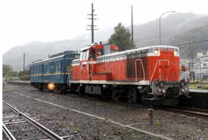
・マヤによる軌道狂いの検査

軌道狂いの検査を年に1回のペースで実施しております。マヤが運行できない部分は手測りにより実施しております。