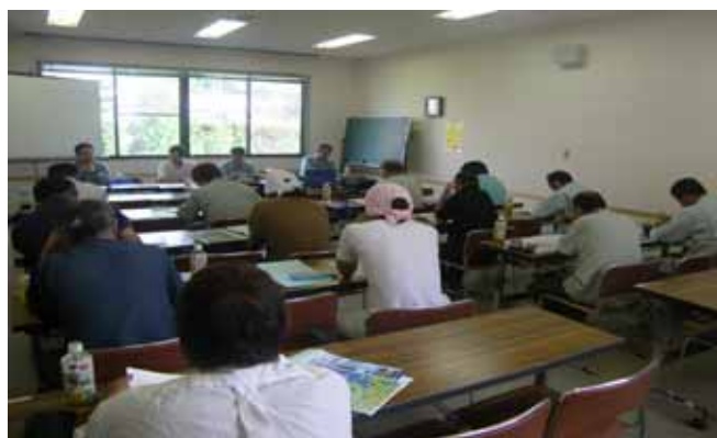
・列車見張り員講習会