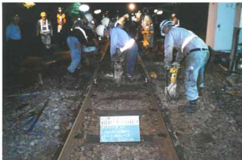
・分岐器交換作業