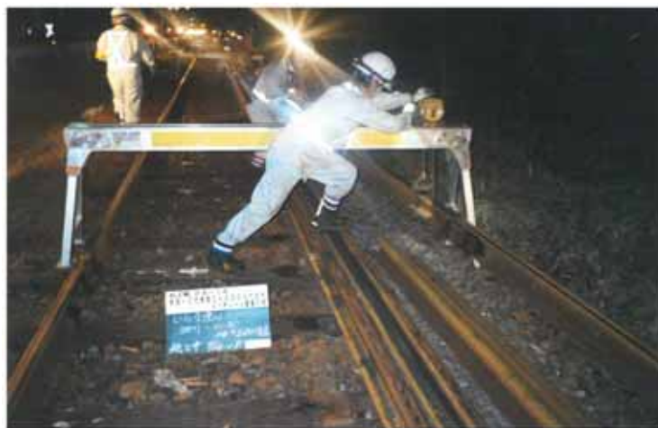
・有田～三代橋間、西有田～大木間等の5か所

37Kから40Nにレールを重量化することにより、耐久性の向上及び列車運行の安全確保を図る。