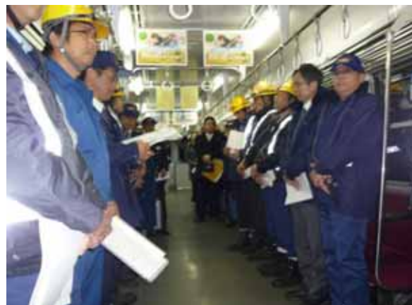
・社長訓示を聞く参加者