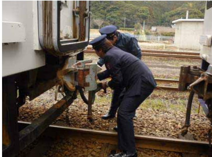
・運転士見習に対する先輩運転士の指導