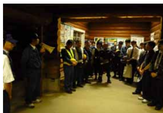
・訓練終了時の反省会(佐々駅)