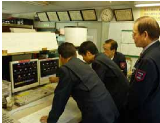
・運転指令員の運行表示取扱い訓練2