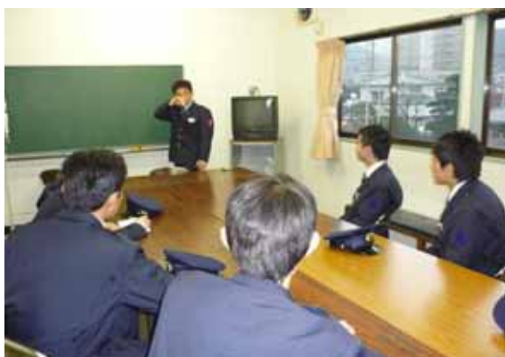
・運転士見習いに対する先輩運転士の特別講義