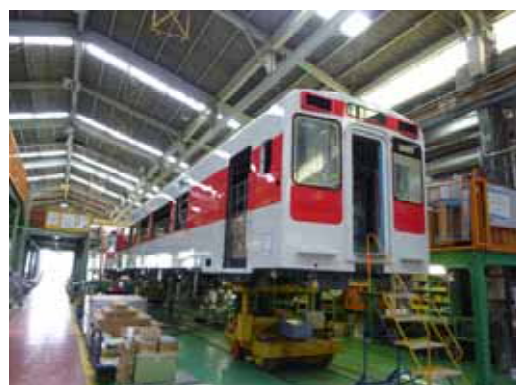
・仕上がり間近の新型車両