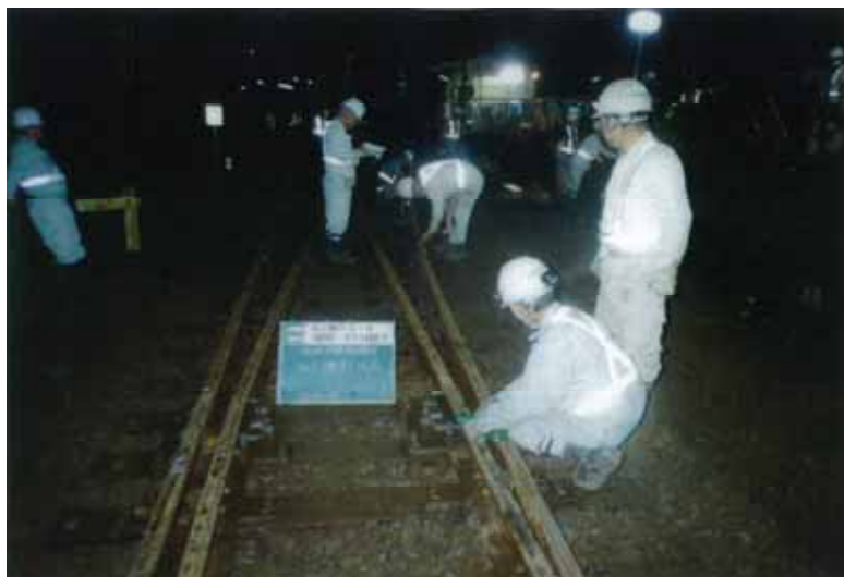
・分岐器交換後の仕上がり検査