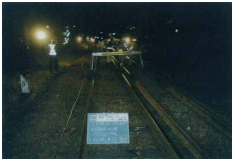
・西有田～大木間、清峰高校～佐々間の2か所

37Kから40Nにレールを重量化することにより、耐久性の向上及び列車運行の安全確保を図る。