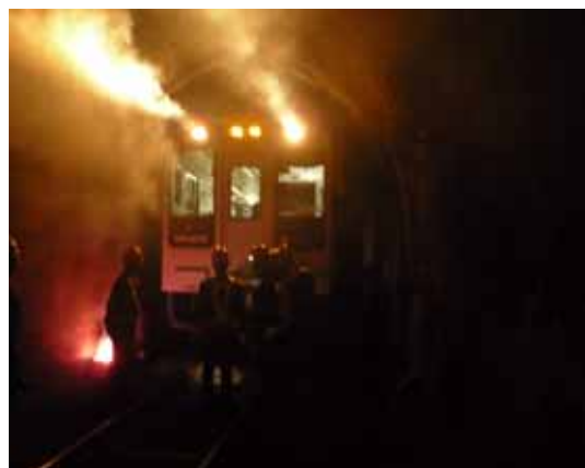
・トンネル内で発生した車両火災