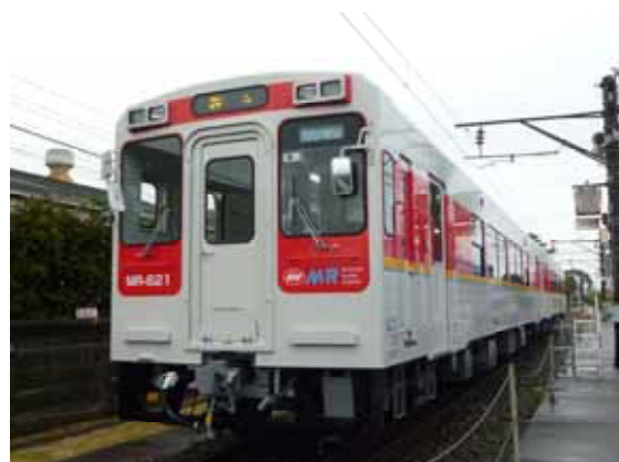
・試験走行に臨む新型車両