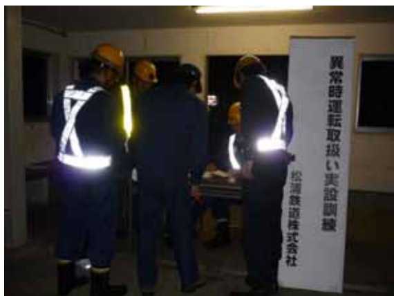
・実説訓練開始(現地対策本部(神田駅))