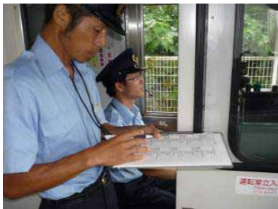
・新人運転士に対する添乗指導