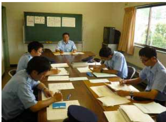
・新入社員の教育訓練1