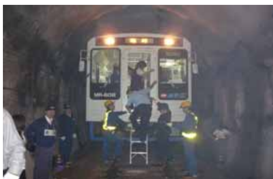
・車内の一般乗客の救出