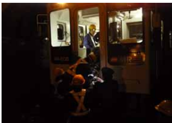
・担架による重症者の救出