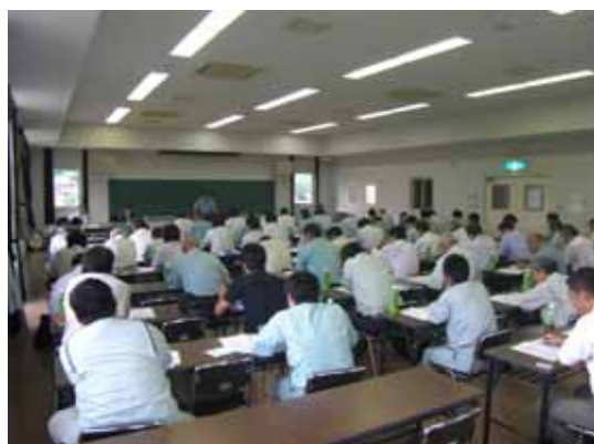
・協力会社社員の参加による事故防止研修会議