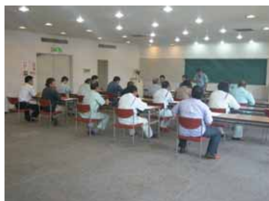
・列車見張り員講習会