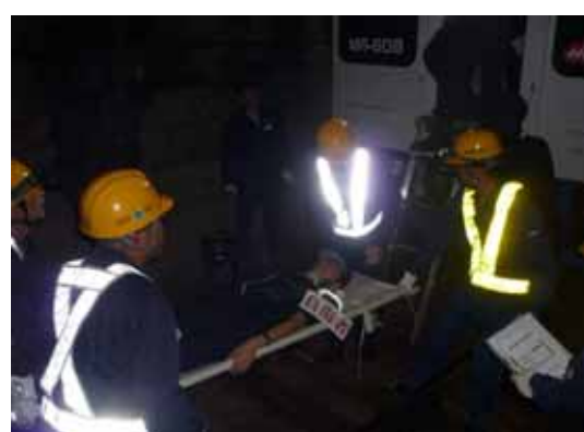
・担架で搬送される重症者