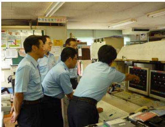
・運転指令員の運行表示取扱い訓練1