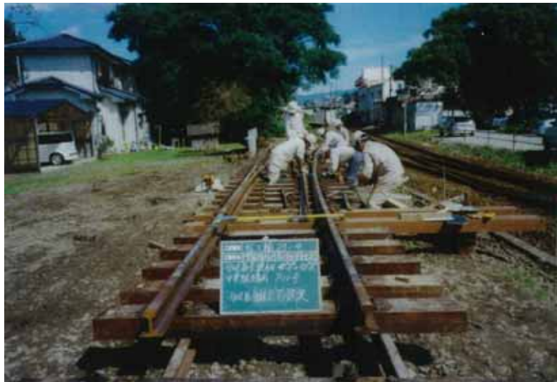
・中里駅構内での分岐器組立

分岐器の重量化 老朽化した40N分岐器を50Nに交換して耐久性を向上させ、安全安定輸送を図る。