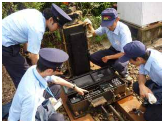
・新入社員の教育訓練2