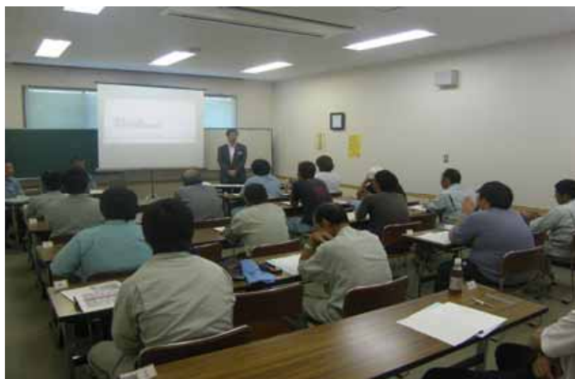
・列車見張り員講習会