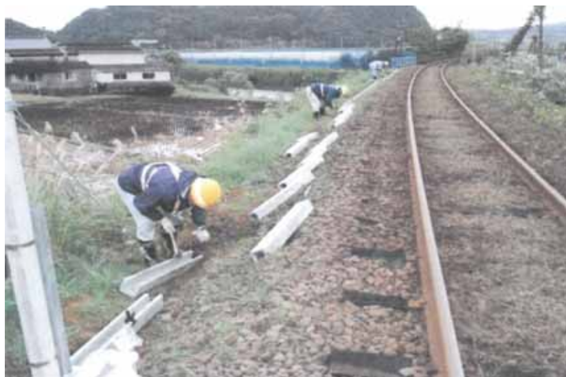
・蔵宿～夫婦石駅間の通信線ケーブルの敷設作業