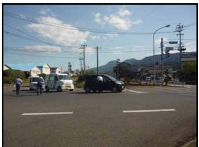
・西九州線 三協踏切でのチラシ配布