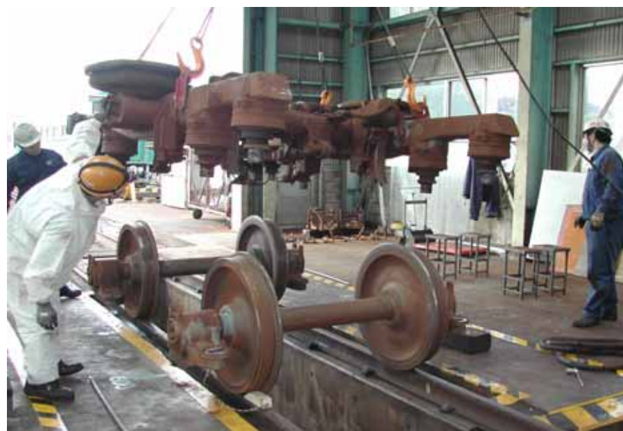
・佐々の車両基地にて実施されたMR600の全般検査