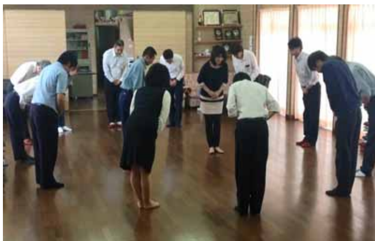
・鉄道に対するお客様の信頼を更に深める