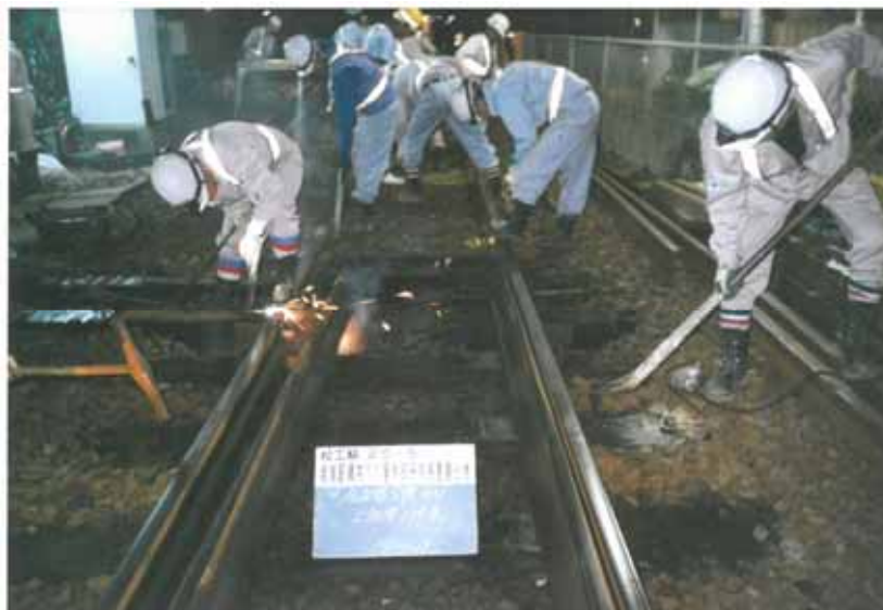
・分岐器交換作業