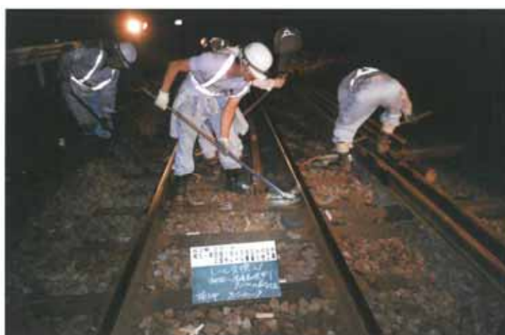
・レールの交換作業