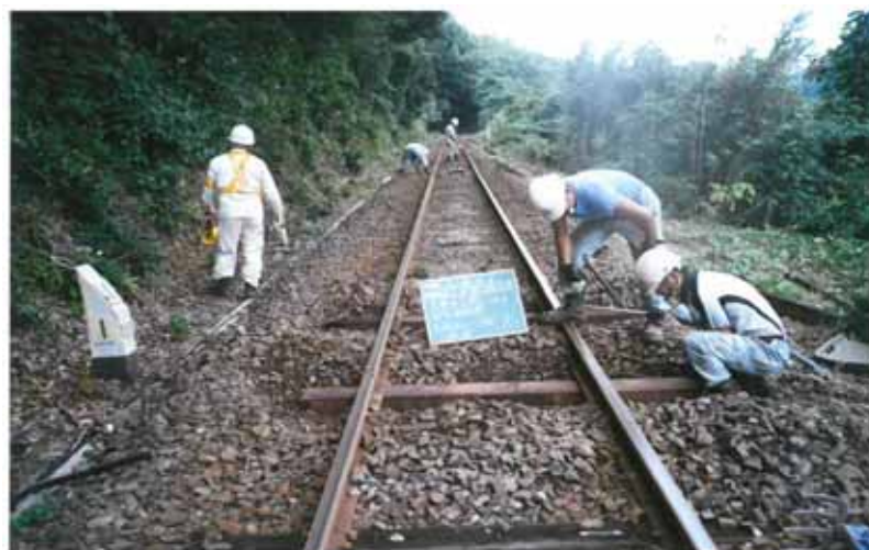
・有田～佐世保間の木マクラギ交換状況