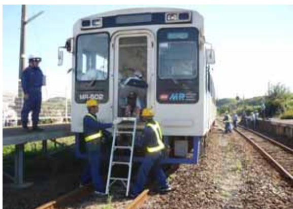
・車内負傷者の救出