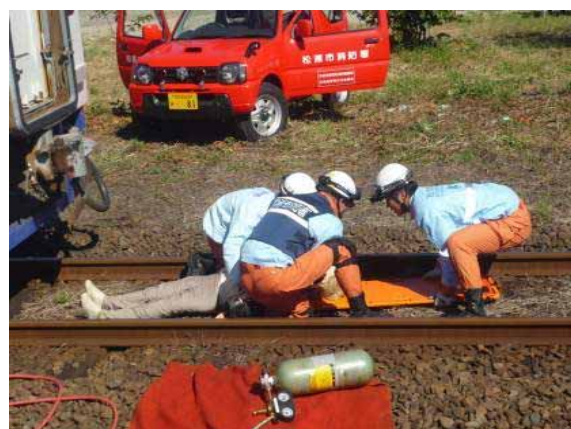
・乗用車の負傷者の手当て