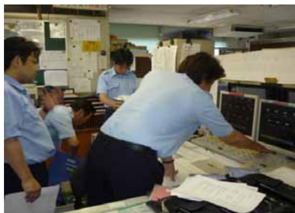
・運転指令員による運行管理の訓練状況