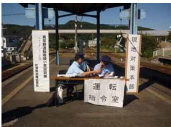
・現地対策本部の設置

今年度は、踏切事故を想定し松浦市消防局との合同による救急想定訓練を実施しました。