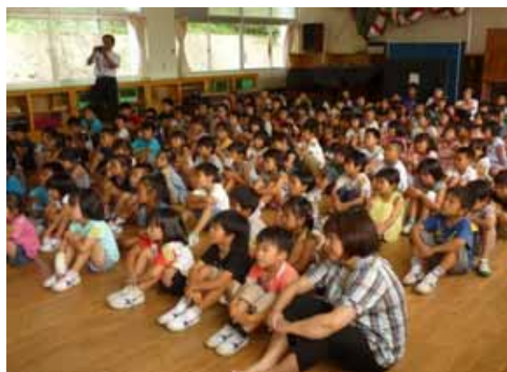
松浦鉄道沿線の小学校を訪問し安全教育を実施