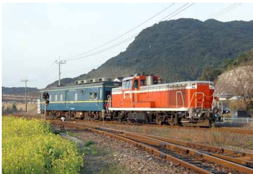
・マヤによる軌道狂いの検査

軌道狂いの検査を年に1回のペースで実施しております。マヤが運行できない部分は手測りにより実施しております。