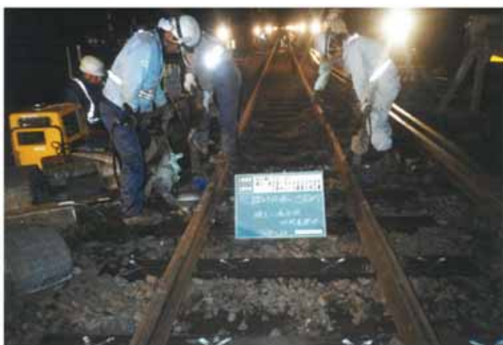
・楠久～鳴石間等の3か所

37Kから40Nにレールを重量化することにより、耐久性の向上及び列車運行の安全確保を図る。