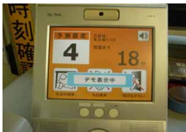
・テレビ電話による地震速報の活用について