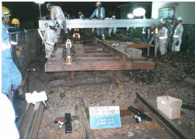
・相浦駅、上相浦駅等の合計7組

分岐器の重量化 老朽化した40N分岐器を50Nに交換して耐久性を向上させ、安全安定輸送を図る。