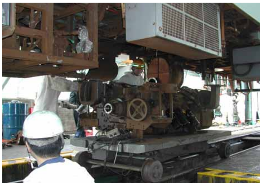
・佐々の車両基地にて実施されたMR600の重要部検査