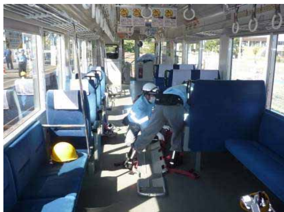
・車内負傷者の救出