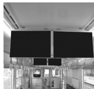
掲出箇所アップ 車内中吊