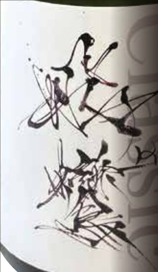
森酒造 Mori Shuzo