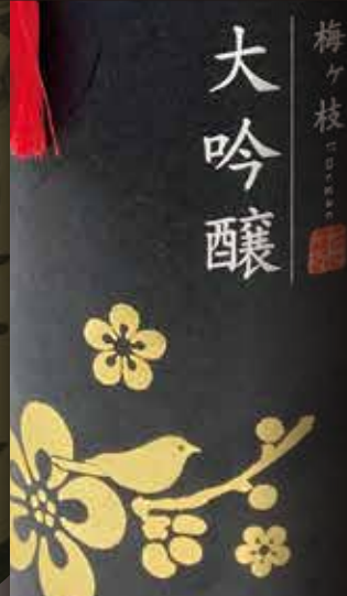
梅ヶ枝酒造 Umegae Shuzo