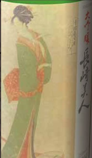
福田酒造 Fukuda Shuzo