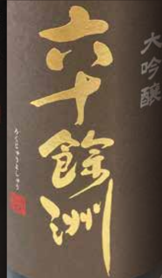
今里酒造 Imazato Shuzo